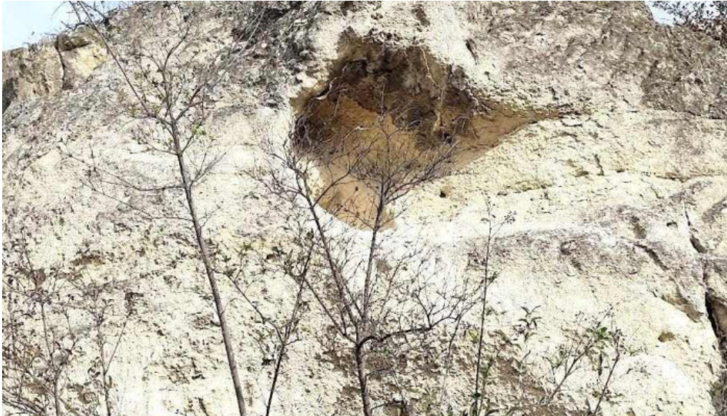
Antal banya hegy