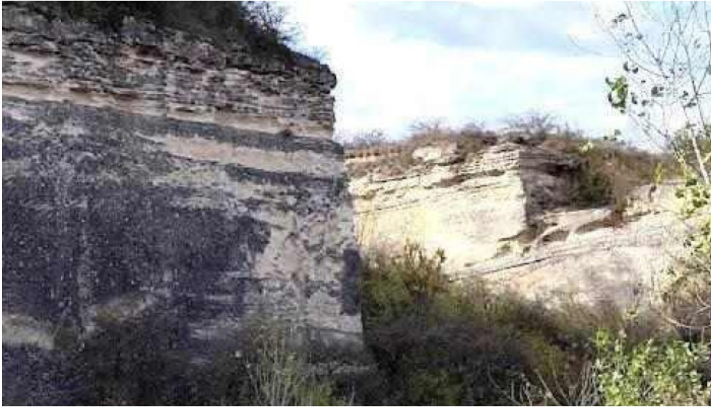
Antal banya soskut