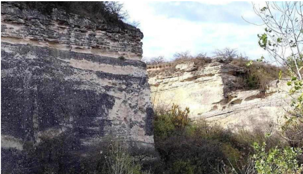
Antal banya osszes