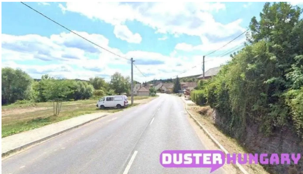
Karancslapujt? k?hegy karancslapujt?