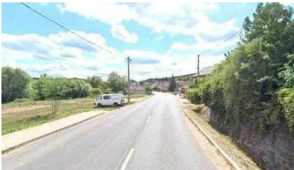
Karancslapujtó kohegy összes