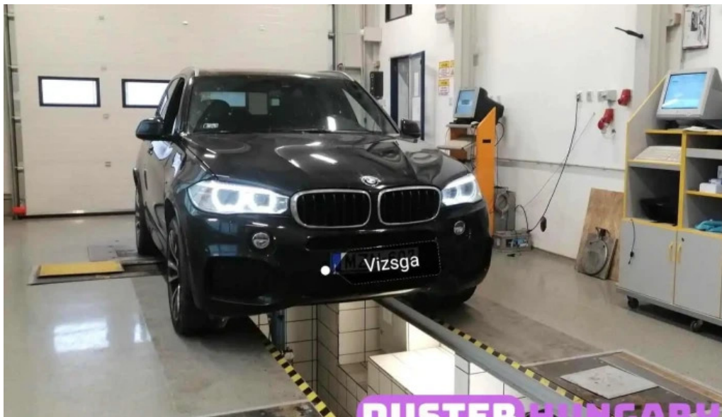
Nagy autorszerviz lengyeltoti lengyeltoti