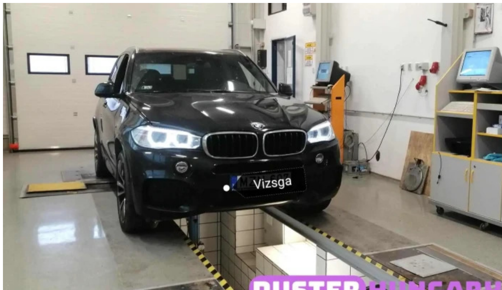
Nagy autoszerviz lengyeltoti osszes