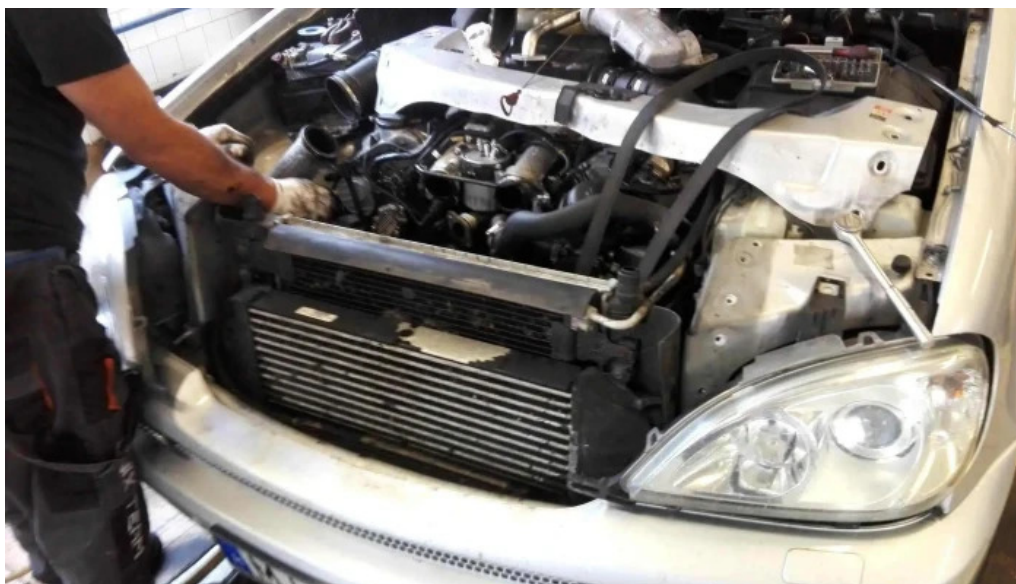
Nagy autószervez lencyeltoti a tulajdonostol