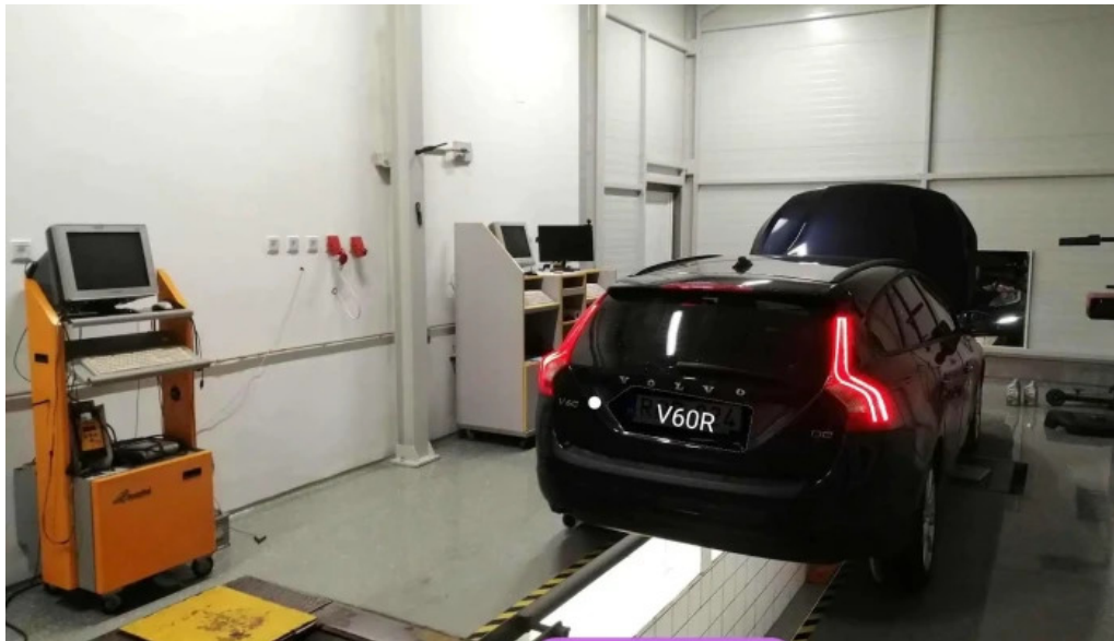
Nagy autorszerviz lengyeltoti muhely